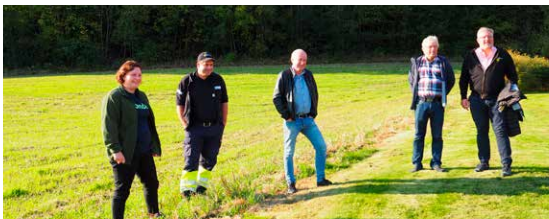
Telemark Bondelag inviterte pressen til Hjelseth gård 15. oktober da klimakalkulatoren ble lansert.

Kurs i bruk av klimakalkulatoren vil bli tilbudt i 2021.